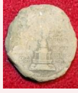
जुम्लाबाट प्राप्त च:च

यस अभिलेखालयले भाषा, धर्म, इतिहाससंग सम्बन्धित अभिलेख र ऐतिहासिक दस्तावेजहरू संकलन भण्डारण तथा संरक्षण गरी सो क्षेत्र मा अध्ययन अनुसन्धान गर्न चाहनेहरूका लागि उपलब्ध गराउने उद्देश्य राखेको छ ।