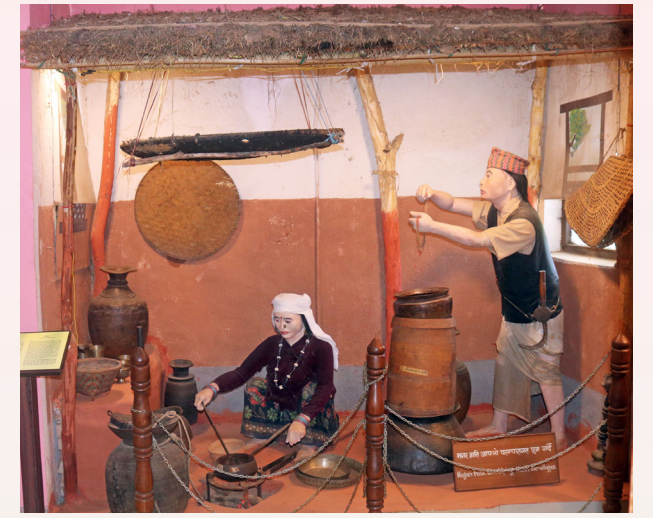
परम्परागत पूजाआजा गर्दै मगर