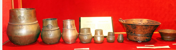
परम्परागत नापतौलका भाँडाकुडा