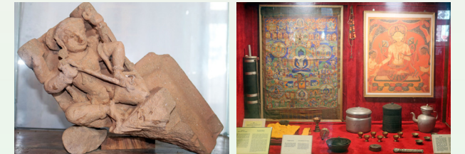
काँक्रेविहारबाट प्राप्त प्रस्तर मुर्ति