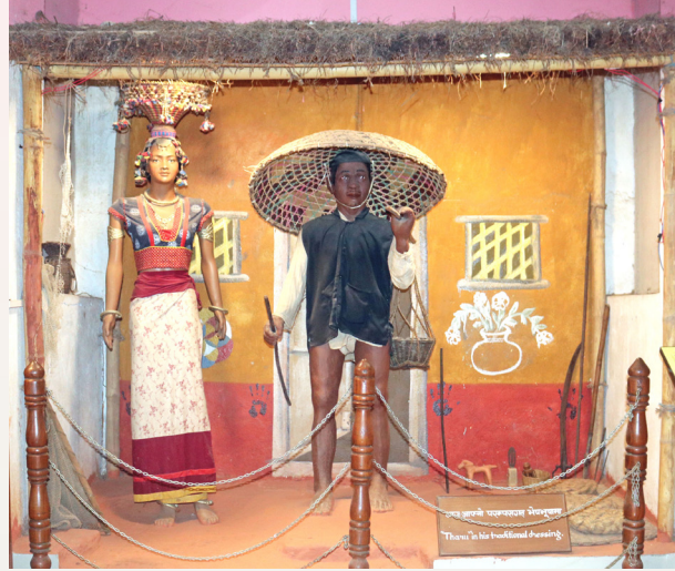
परम्परागत भेषभूषमा सजिएका थारु

यस कक्षमा इतिहास तथा संस्कृतिसँग सम्बन्धित वस्तुहरू संग्रहालयले विषयवस्तु अनुसार वर्गीकरण गरी प्रदर्शनीमा राखेको छ। जाजरकोट दरवारको प्रतिकृति, विभिन्न जातजाति (मगर, थारु, राउटे, कुमाल)को संस्कृति झल्काउने मोडेल अर्थात् डायरोमा, गरगहना, परम्परागत भाँडावर्तन, हातहतियार, परम्परागत नापतौलका इकाईगत सामाग्रीहरू, विभिन्न तिथिक्रमका मुद्राहरू, परम्परागत लोकबाजाहरू, सामाजिक पक्षलाई झल्काउने फोटोहरू र काठको नाउ प्रदर्शनीमा राखिएको छ।