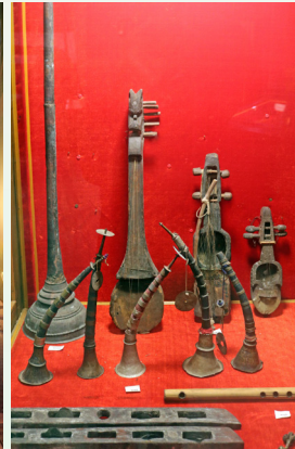
परम्परागत लोक बाजाहरू