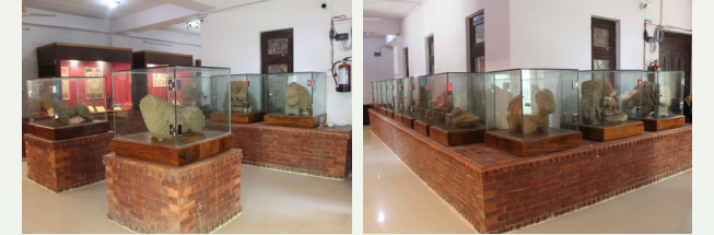
काँक्रेविहारबाट प्राप्त प्रस्तर मुर्तिहरू

यस कक्षमा विशेषगरी काँक्रेविहारबाट प्राप्त पुरातात्विक वस्तुहरू: औजार, कलात्मक प्रस्तर मुर्तिहरू, फलामका हुक, प्राचीन माटाका भाडाँका टुक्राहरू, सुल्पा बनाउने प्रविधि, जुम्लाबाट प्राप्त माटाका चःचहरू, दैलेखबाट प्राप्त लालमोहर, रुक्कापत्र, हिमाली भेगको लामा संस्कृति झल्काउने भेषभुषा, पानीघडी, थाङ्का, माझि जातीसँग सम्बन्धित सामाग्री माछा मार्ने जाल, सुन चाल्ने प्रयोग हुने काठका सामाग्रीहरू प्रदर्शनीमा राखिएको छ।