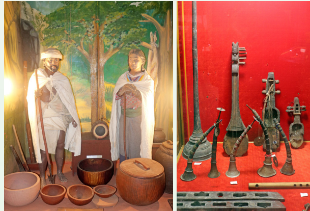
परम्परागत भेषभूषमा सजिएका राउटे