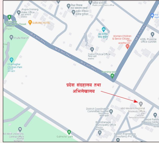
प्रदेश संग्रहालय तथा अभिलेखालय