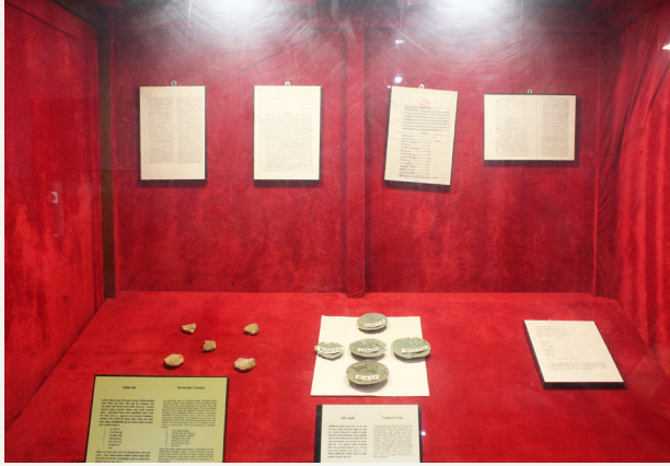
दैलेखबाट प्राप्त अभिलेखहरू